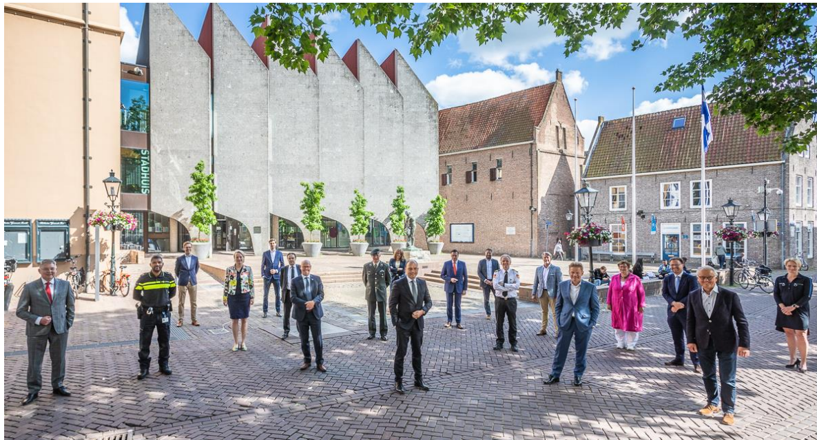
Het Regionaal Beleidsteam (RBT) actief ter bestrijding van de Covid-19-crisis.