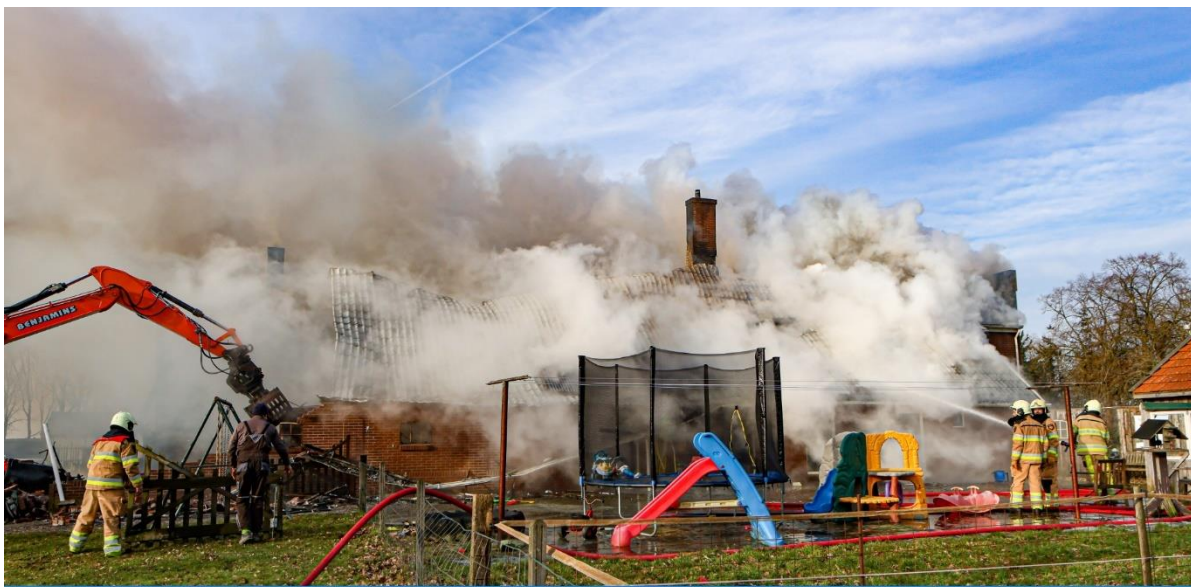
30 januari 2021 – woningbrand in Sibculo, gemeente Hardenberg.