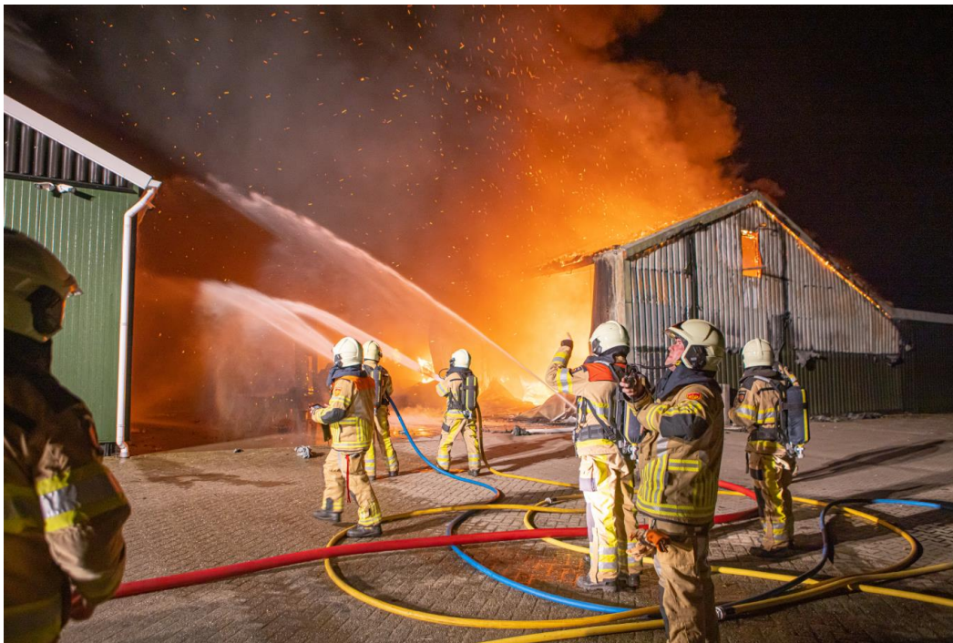
17 februari 2021 – zeer grote brand bij firma Braakman in Laag Zuthem, gemeente Raalte

Hoofdstuk 2 gaat over de beleidsmatige stand van zaken van de uitvoering van de programmabegroting. Daarna volgt in hoofdstuk 3 de financiële stand van zaken van de programmabegroting. Onderdeel hiervan zijn twee verplichte overzichten, namelijk het aangepaste overzicht taakvelden en het overzicht van baten en lasten. Tot slot wordt in hoofdstuk 4 ingegaan op de bedrijfsvoering.