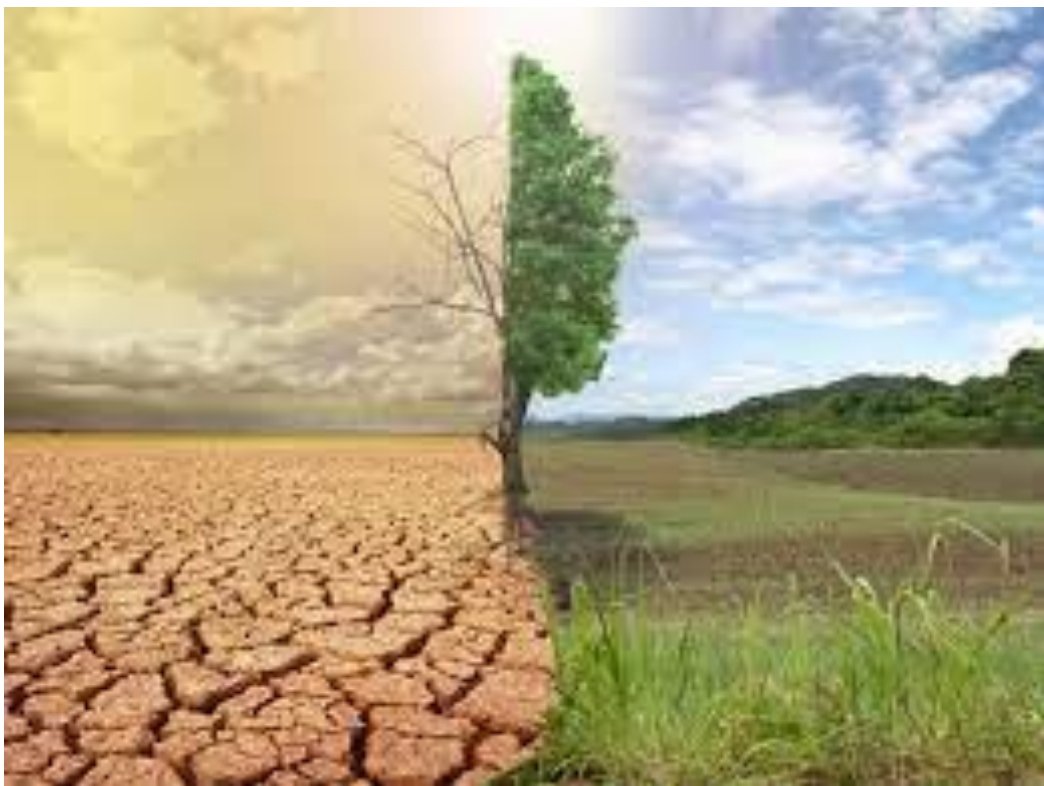
Droogte als crisis. Klimaatadaptatie als oplossing.

ervaring in de eerste vier maanden van 2021 leert dat dit niet op alle fronten lukt. Er worden daarom prioriteiten gesteld, op basis van risicogerichtheid. We focussen ons op die zaken waar we het verschil kunnen maken. Ten eerste betreft dit de meer complexe trajecten waarbij grotere risico's spelen en de maatregelen niet rechtstreeks uit de regelgeving te halen zijn. Ten tweede richten we ons de komende periode op het ondersteunen van de gemeenten bij de advisering op veilige evenementen. Hierdoor faciliteren we de gemeenten bij het mogelijk maken van activiteiten, zodra de coronamaatregelen dat toelaten. Ten derde geven we voorrang aan de samenwerking binnen de regio bij de implementatie van de Omgevingswet. Dit omdat we daar op termijn het meest bij gebaat zijn.